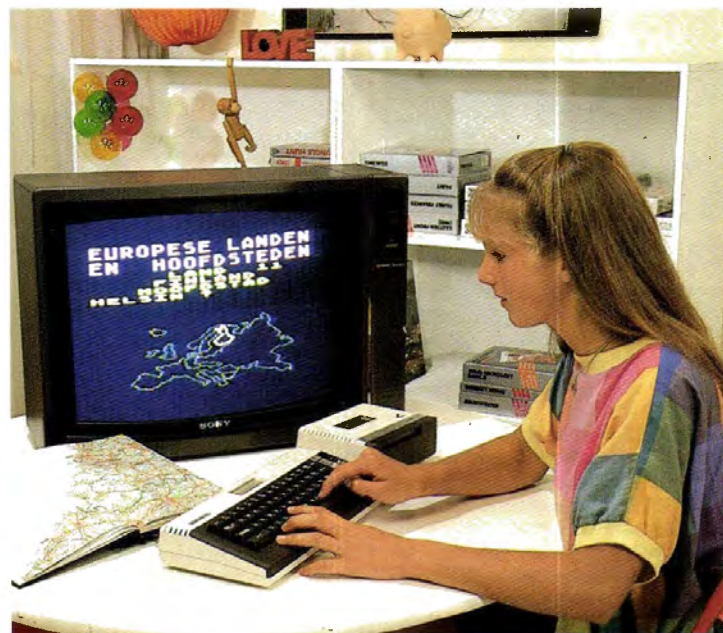
...géén versimpeld kantoorstelsel, maar ontwikkeld voor gezinsgebruik...