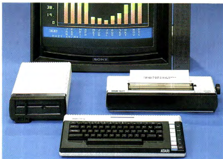
De XL-serie omvat een complete serie randapparatuur...

Alles wijst erop dat de 600 XL, de eerste van een gloednieuwe serie Atari homecomputers, precies op het goede moment komt. De media hebben de laatste tijd zeer veel aandacht besteed aan het fenomeen homecomputer. Scholen gaan beginnen met computeronderwijs en zelfs de politiek heeft ontdekt dat Nederland achterop dreigt te raken. De Tweede Kamer wil meer geld beschikbaar stellen voor dat computeronderwijs. Belangrijk is dat steeds meer mensen gaan beseffen dat: