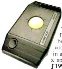
Trak-Ball Controller De meest gevoelige besturing, speciaal voor wie gewend is in automatenhallen te spelen f 199,- Bestelnummer CX 22