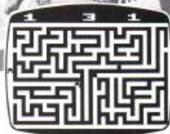
MAZE CRAZE™ Game Program™ A Game of Cops 'n Robbers