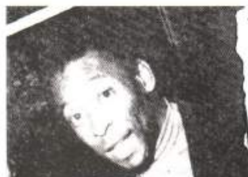
Pelé, sportman van...