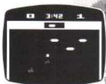
PELE'S CHAMPIONSHIP SOCCER™ Game Program™