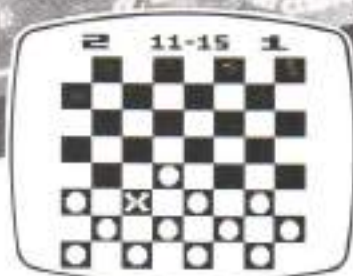
VIDEO CHECKERS™ Game Program™

Amerikaans dammen (CHECKERS) wijkt wat spelregels betreft, duidelijk af van ons Europese damspel. De reden dat wij tóch besloten hebben om Checkers ook in ons land uit te brengen, is omdat Checkers zondermeer 'n briljante 'denksport-cassette' is. Met maar liefst negen spelnivo's, waarbij de computer niet minder dan negen zetten vooruit kan denken! De eerste negen spellen zijn normaal Checkers, met in vergelijking tot ons damspel drie afwijkende spelregels: 1) Achteruitslaan kan niet. 2) Een dam beweegt als 'n normale steen, maar kán wel achteruit slaan. 3) Het bord kent zes rijen stenen i.p.v. 'onze' acht rijen.